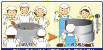
一度に大量の仕込みが可能となり、清掃人員は5名から3名に、1日で100分の清掃時間が短縮

<独自の工夫> 各工程の現場責任者及び現場リーダーが月に1回、アルバイトパートに業務効率化に対するアンケートを取り、集計結果を専務取締役にフィードバックして改善を行っている。