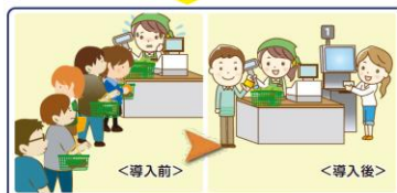
レジの精算時間が1.5倍の速さになり、預り金や釣銭の受け渡しの間違いがなくなった

<独自の工夫> 各冷蔵ケースの本体電源をこまめにOFFにしたり、(別スイッチを取り付け)、同業他社と比べ営業時間を短くしつつ商品を売りつくすようにしたりし、廃業ロスや保管設備費の削減につなげている。