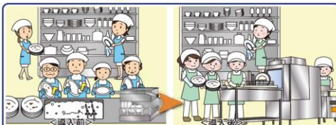
洗浄人員は6名から5名に、食器洗浄・乾燥時間が2/3に短縮

<実施内容>新型食器洗浄機を導入したことにより、洗浄・乾燥に係る人員や時間、電力、水、洗剤を削減することができた。また、掃除や整理整頓など、他の作業時間を創出できた。